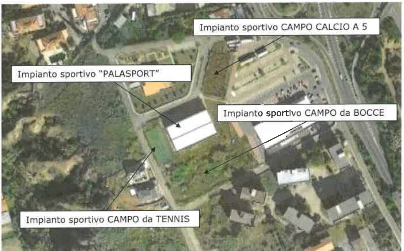
Figura 2 Impianto sportivo "PALASPORT" – CAMPO DA TENNIS – CAMPO CALCIO A 5- CAMPO DA BOCCE - Località Monti