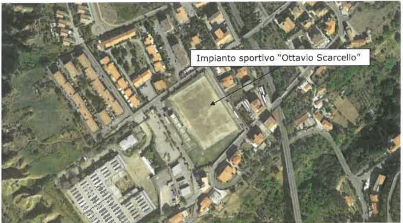
Figura 1 Impianto sportivo "Ottavio Scarcelli"- Località Sant'Antonio Abate